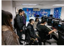
人工智慧與數位 創新實驗室