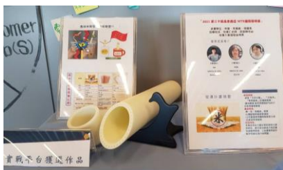
企管系學生榮獲「2021 第二十屆馬來西亞 MTE 國際發明展技發明競賽」金牌