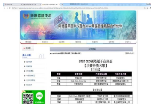
2020 CEO 國際電子商務盃行銷組亞軍