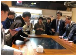
未來超市智慧餐桌- 日本弘國大學師生參訪