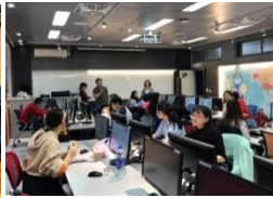
商貿智慧虛擬 互動中心