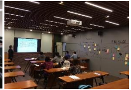
創新商業模式 實驗室