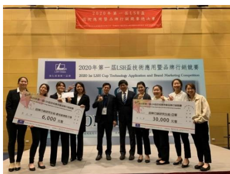
2020 第一屆 LSH 盃技術應用暨品牌行銷競賽亞軍