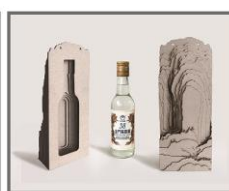
多設系學生榮獲「2021 美國 One Show 廣告創意學生獎(Young Ones)」銀牌