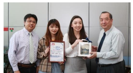
109 教育部 U-START 計畫獲獎