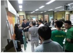
O2O 營運實驗室 系統操作示範